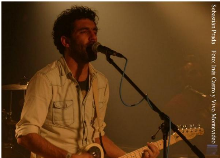
Sebastián Prada

Desde el patio de la escuela hasta el mar en alguna mirada, cuentos en la biblioteca, en el diván con la cabeza en la almohada. Puedo dejar al olvido, tus palabras locas puedo tomarlas y usarlas a ver hasta donde me da la boca. Ir buscando la manera de avanzar intentando de vuelta, caminando con el sueño de llegar golpeando más de una puerta.