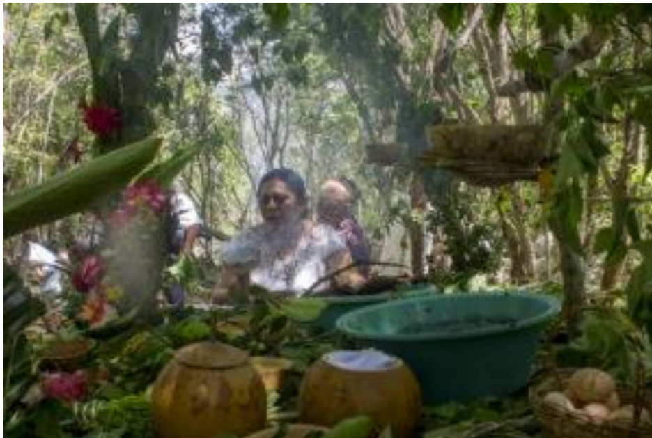
Aniversario de la Unión de Pobladores en 2018

En la conformación de la Unión las mujeres del pueblo de Chablekal han tenido un papel sumamente importante exigiendo el derecho que poseen a la tenencia de la tierra y el territorio, un aspecto que es ignorado por la jurisdicción agraria, y haciendo efectivo también el derecho que tienen a participar con su voz y su voto en las decisiones de lo que suceda con los montes. Aunque en la Unión participan casi un centenar de mujeres mayas hasta ahora el Tribunal Unitario Agrario 34 no se ha pronunciado con respecto al caso desde la perspectiva de género.